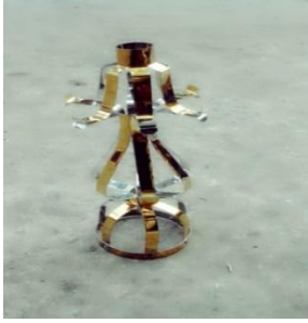
ပုံ(ခ)-ဆပ်သွားဖူး