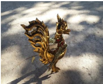
ပုံ(င)-ဟင်္သာ