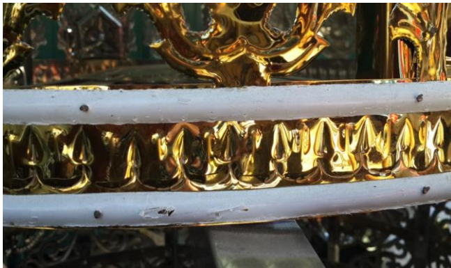
ပုံ(၁၀) - ဖောင်းကြိုးတပ်ဆင်ပြီးပုံ