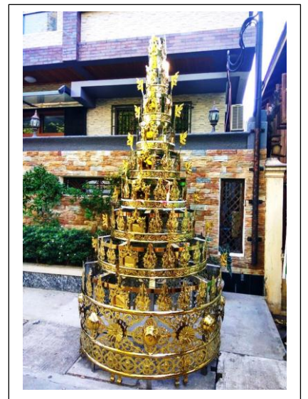
ပုံ(ဝ)-ပထမဘုံမှ နဝမဘုံထိ ထီးအင်္ဂါရပ်ပြီးစီးပုံ