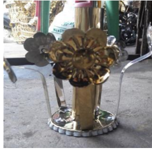
ပုံ(ဂ)-စိန်ပန်းခိုင်