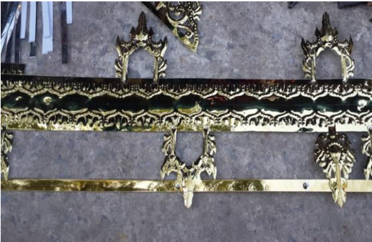
ပုံ(ဗ)-ကြိုးနှင့် တန်းအား မုခ်၊ သူကြီးတို့ဖြင့် တွဲစပ်ထားပုံ