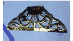
ပုံ(၉) - ပန်း