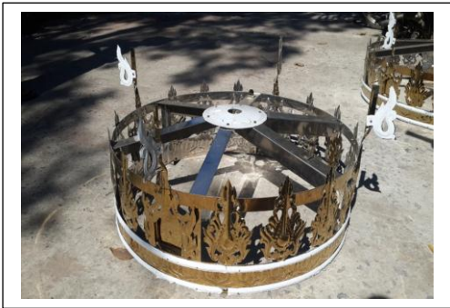
ပုံ(မ)-တတိယဘုံအင်္ဂါရပ်ပြီးစီးမှု

တတိယဘုံ၊ စတုတ္ထဘုံနှင့် ပဉ္စမဘုံတို့၏ပြုလုပ်မှု အဆင့်ဆင့်သည် ဒုတိယဘုံ၏ ပြုလုပ်မှုအဆင့်တိုင်းပင် ကြိုးနှင့်တန်းအား မုခ်၊ သူကြီးနှင့် တွဲစပ်တန်ဆာဆင်ခြင်း ဖြစ်ပါသည်။ ဆဋ္ဌမဘုံနှင့် သတ္တမဘုံ ပြုလုပ်ရာတွင် ကြိုးနှင့်တန်းအား မုခ်(၄)ခုနှင့်သာ တွဲစပ်တန်ဆာဆင်ပါသည်။ အဋ္ဌမဘုံနှင့်နဝမဘုံ ပြုလုပ်မှုတွင် မုခ်မပါရှိဘဲ သူကြီးများကို ကြိုးနှင့်တန်းဖြင့် တပ်ဆင်တန်ဆာဆင်ရပါသည်။ တန်ဆာဆင်ထားသော ထီးများအား ထီးတော်ဖြစ်စေရန် ခွေရပြီး တောင့်တင်းခိုင်မာစေရန် ထီးလက်များ တပ်ဆင်ရပါသည်။ ဘုံတစ်ဆင့်စီ၏ အချင်းသည် အောက်မှအထက်သို့ သုံးပုံတစ်ပုံ လျော့နည်းသွား မည်ဖြစ်ပါ သည်။