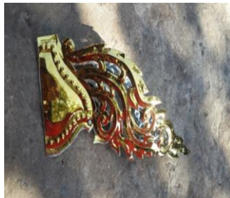
ပုံ(စ)-ငှက်မြတ်နား