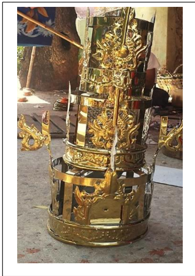
ပုံ(လ)-သတ္တမဘုံ၊ အဋ္ဌမဘုံနှင့် နဝမဘုံအင်္ဂါရပ်ပြီးစီးမှု