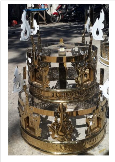
ပုံ(ရ)-ပဉ္စမဘုံနှင့် ဆဋ္ဌမဘုံ အင်္ဂါရပ်ပြီးစီးမှု