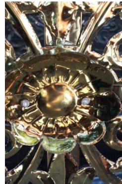
ပုံ(၁၁) - ကြာဖတ်တပ်ဆင်ပြီးပုံ