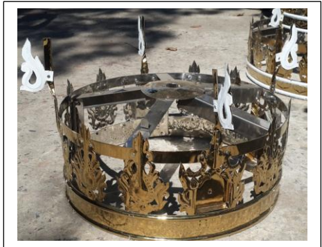
ပုံ(ဃ)-စတုတ္ထဘုံအင်္ဂါရပ်ပြီးစီးမှု