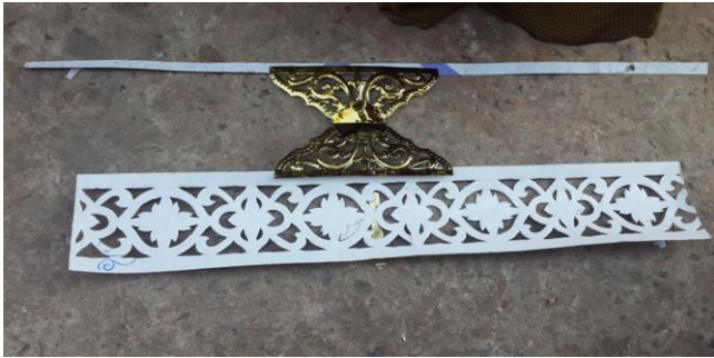
ပုံ(၄)ဘီလားကြိုးနှင့်တန်းကိုပန်းဖြင့်တပ်ဆင်ထားပုံ

ထီးလက်တပ်ဆင်ရပါသည်။ ဖလားနှင့်ကြာဖတ်အား ပန်းကွက်တစ်ကွက်စီတွင် တပ်ဆင် တန်ဆာဆင်ပြီးလျှင် အောက်ဆုံးဘုံ၏ အင်္ဂါရပ်ပြီးစီးပါသည်။