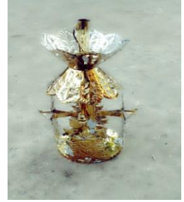
ပုံ(ဃ)-စိန်ဖူးကလပ်