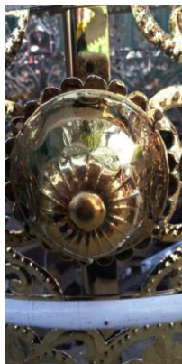
ပုံ(၁၂) - ဖလားတပ်ဆင်ပြီးပုံ