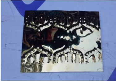
ပုံ(ပ)-ကြိုး

ဒုတိယဘုံပြုလုပ်ရာတွင် ကြိုးနှင့်တန်း၏အရှည်သည် ပထမဘုံရှိ ကြိုးနှင့်တန်း၏ အရှည်အောက် သုံးပုံတစ်ပုံ လျော့၍ပြုလုပ်ရမည်ဖြစ်ပါသည်။ ၎င်းကြိုးနှင့်တန်းအား မုခ်နှင့် သူကြီးတို့ဖြင့်တွဲစပ်၍ တန်ဆာဆင်ပါသည်။ ပထမဘုံကဲ့သို့ ပန်းမပါရှိပါ။ တန်ဆာဆင် ပြီးသောထီးအား ထီးတော်ဖြစ်စေရန် ခွေရပါသည်။ ခွေထားသောထီးအား တောင့်တင်း ခိုင်မာစေရန် ဖောင်းစီးရပြီး ထးလက်တပ်ဆင်ရပါသည်။ မုခ်များတွင် ဘုရားဆင်းတုတော် များ ထည့်သွင်းပူဇော်ရန် မုခ်အိမ်များ ပြုလုပ်ပြီး မှန်ကင်းတိုင်များ တပ်ဆင်ရပါသည်။ တပ်ဆင်တန်ဆာဆင်ပြီးလျှင် ဒုတိယဘုံ၏အင်္ဂါရပ် ပြီးစီးပါသည်။