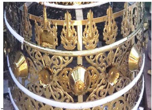
ပုံ(၁၃) - ပထမဘုံပြီးစီးပုံ