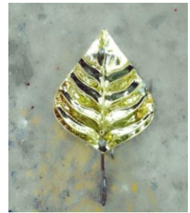
ပုံ(ဆ)-ညောင်ရွက်