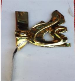
ပုံ(ဖ)-မှန်ကင်းတိုင်