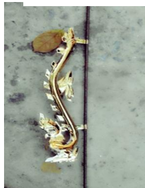
ပုံ(ဇ)-နယား