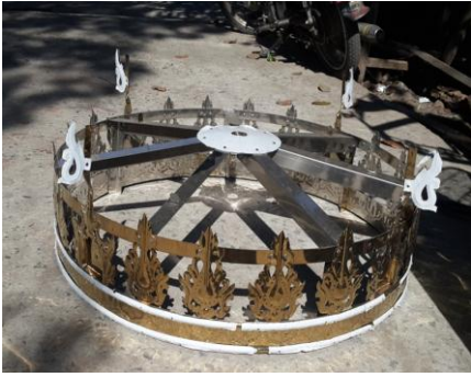
ပုံ(ဘ)-ဒုတိယဘုံအင်္ဂါရပ်ပြီးစီးပုံ