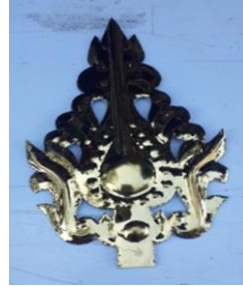
ပုံ(၅) သူကြီး