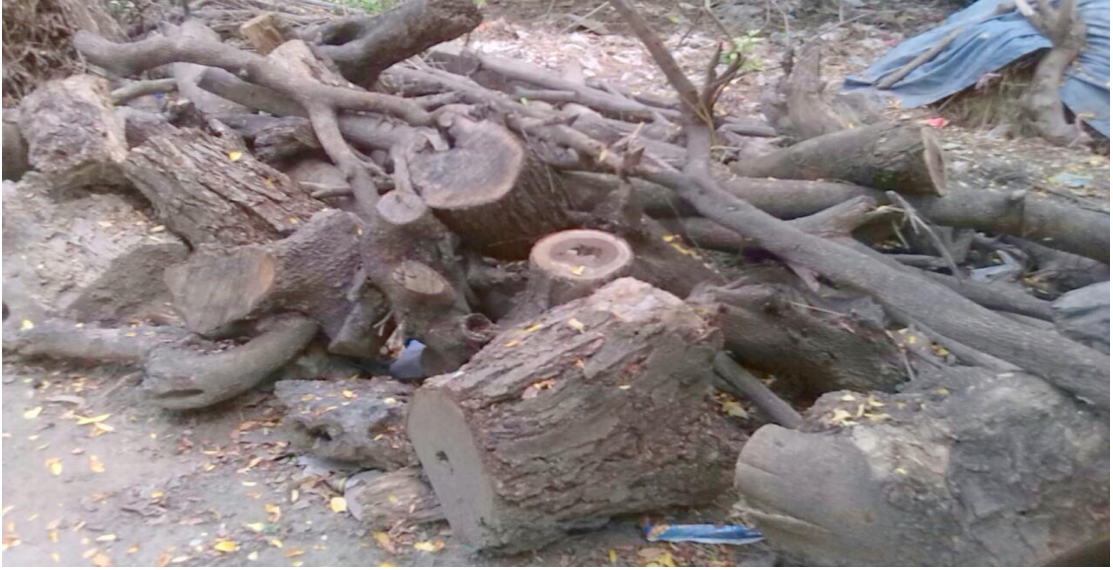
ကောက်ရိုးပြုတ်ရာတွင် အသုံးပြုသောထင်းတုံးများ