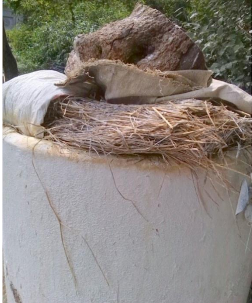
နေလှန်းထားသောကောက်ရိုးများ