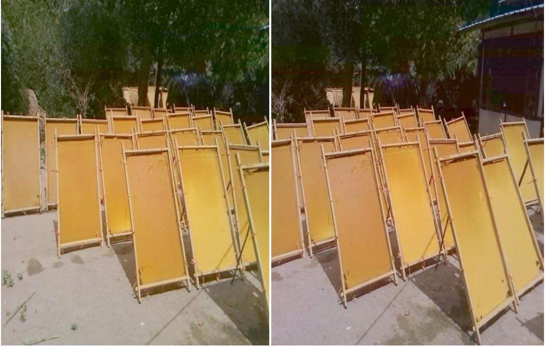
ကောက်ရိုးပျော့ဖတ်ရည် လောင်းထည့်ထားသော ကားချပ်များကိုနေလှန်းထားပုံ