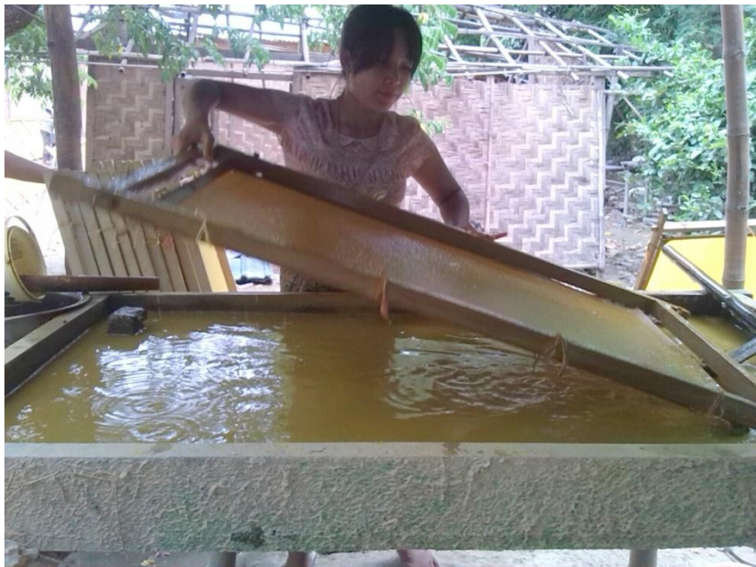
ကားချပ်ကိုဖြည်းညင်းစွာ ဖော်ယူနေပုံ