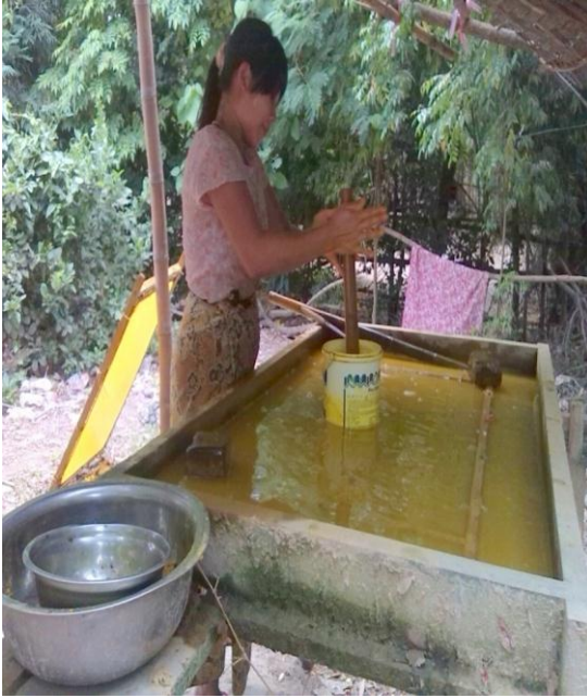
ပျော့ဖတ်များကိုဒလက်ဖြင့်မွှေနေပုံ