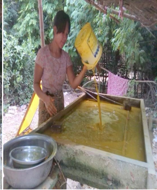
ကားချပ်ပေါ်တွင်ပျော့ဖတ်ရည်များလောင်းထည့်နေပုံ