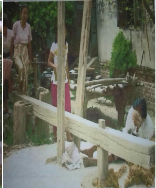
သန့်စင်ထားသောကောက်ရိုးများအား မောင်းထောင်းနေပုံ