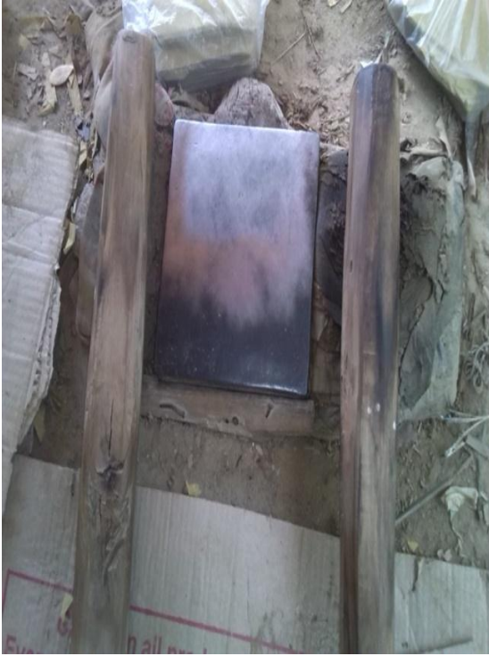
သနပ်ခုံနှင့်သနပ်တုတ်