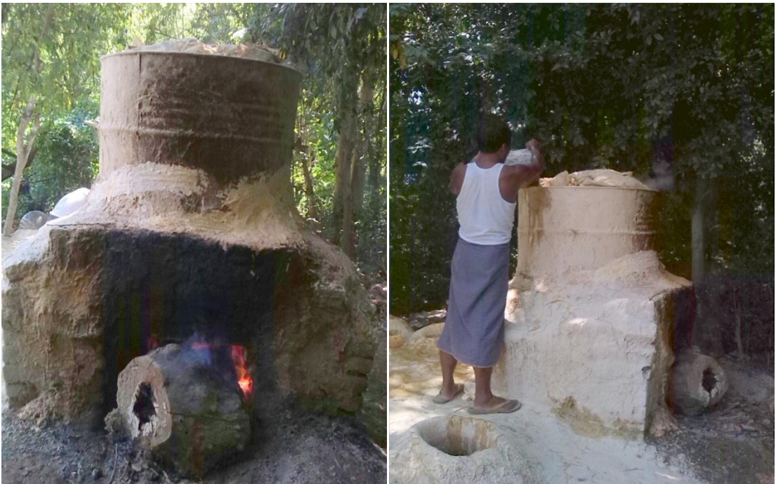
ထုံးသိပ်ထားသောကောက်ရိုးများကို ပေါင်းအိုးထဲတွင် ပြုတ်နေပုံ