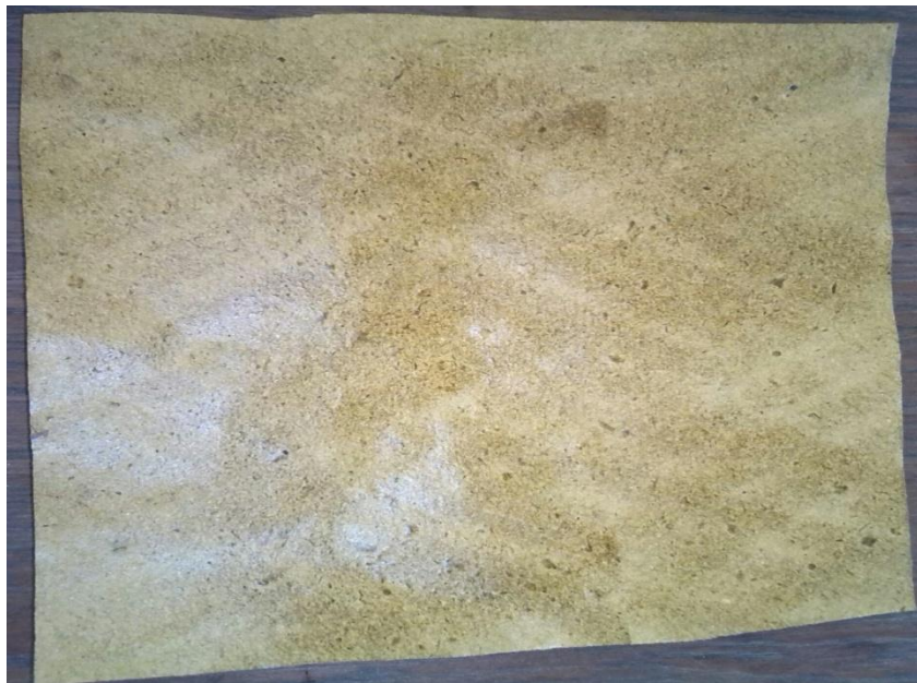
ရိုက်ထားပြီးသောဒဏ်ခံစက္ကူ(သနပ်စက္ကူ)