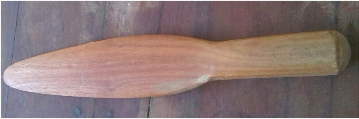
ဇလက်မခန့်ရှိသော(မန်ကျည်းနှစ် သို့ ပိတောက်နှစ်ဖြင့်ပြုလုပ်)ခွာတံ