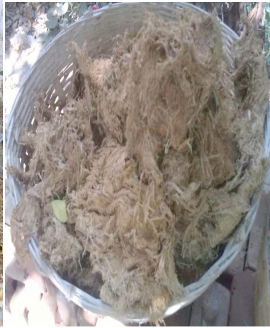
ပြုတ်ထားသောကောက်ရိုးများကို အအေးခံထားပုံ