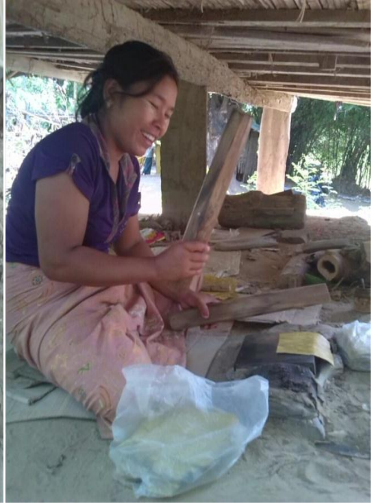
သနပ်ရိုက်နေပုံ