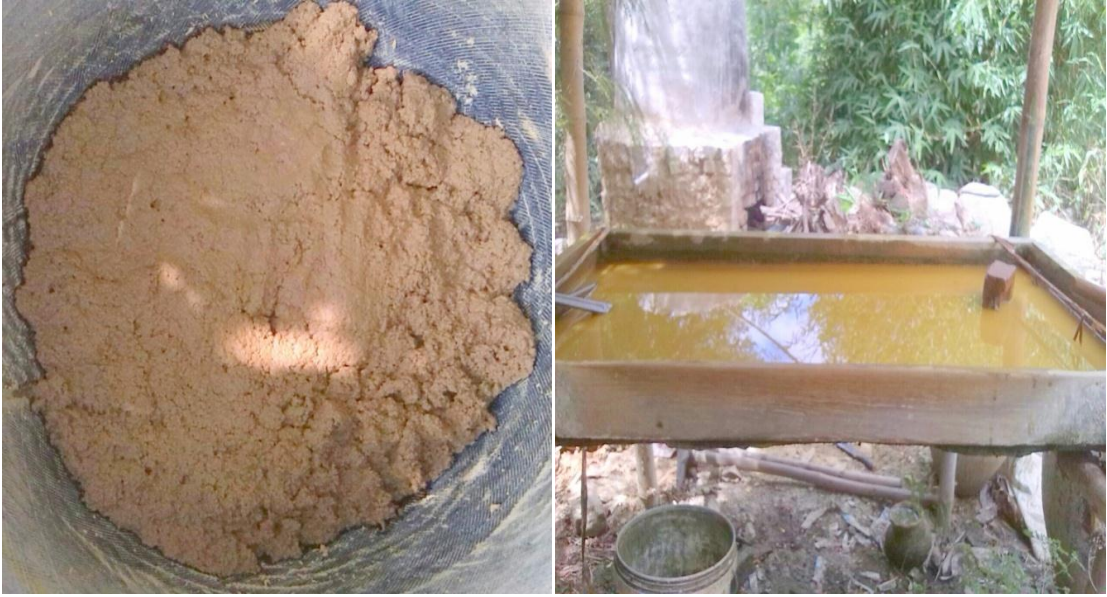
ကောက်ရိုးမှရလာသောပျော့ဖတ်များ